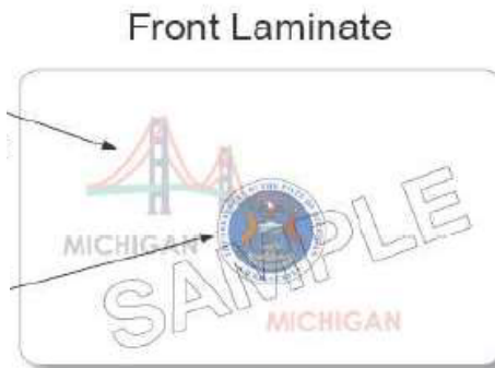
Imagen completa a color del sello: Visible sólo bajo luz UV

Dispositivo tricolor variable ópticamente: Puente y la palabra "Michigan" aparece y desaparece dependiendo de cómo se sostiene la tarjeta